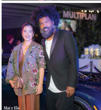
Mai y Elo

The Braman Miami Auto Group sirvió como auspiciador principal de la decimotava entrega anual de la fiesta de ArtNexus durante la feria de arte Art Basel 2019. El evento se llevó a cabo en la azotea del edificio de Braman Miami, el cual fue transformado elegantemente para la ocasión. Allí los invitados disfrutaron de una instalación de arte presentada por la artista plástica brasileña Regina Silveira. Como parte de la actividad, Braman Miami develó su nuevo Bentley Flying Spur mientras los presentes disfrutaban de la música del grupo Bacilos. "Art Basel, no es solo una celebración del arte, es también la oportunidad perfecta para celebrar la cultura en nuestra ciudad" explicó Mike Rodriguez, el General Manager de Braman Miami. ¡Enhorabuena! 🎉