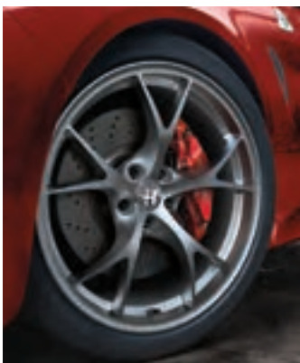
Roues Tecnico de 19 po en aluminium brillant De série sur la Quadrifoglio