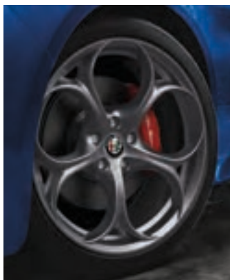
Roues de 19 po en aluminium foncé à cinq trous Livrables en option sur la Giulia, Giulia Sport, Ti et Ti Sport