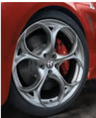
Roues de 19 po en aluminium brillant à cinq trous Livrables en option sur la Quadrifoglio