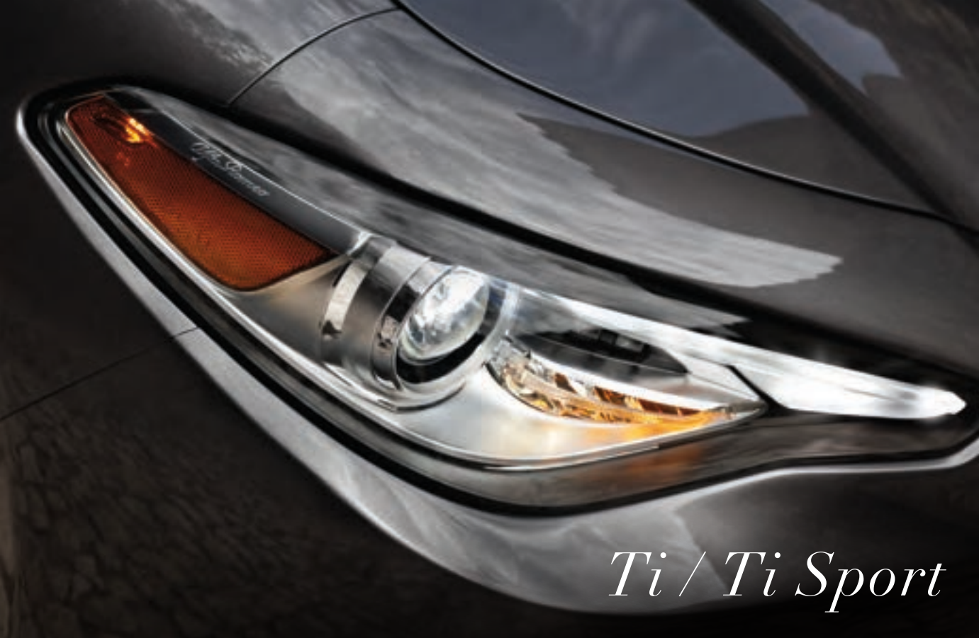
Ti / Ti Sport