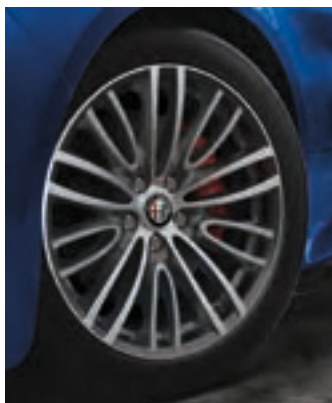
Roues Lusso de 18 po en aluminium De série sur la Ti Lusso