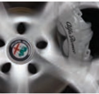
Étriers de frein argent De série sur la Giulia et la Ti Non livrables en option sur la Quadrifoglio