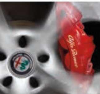
Étriers de frein rouges Livrables en option