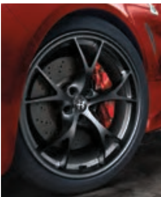
Roues Tecnico de 19 po en aluminium foncé Livrables en option sur la Quadrifoglio