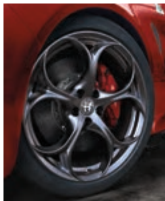
Roues de 19 po en aluminium foncé à cinq trous Livrables en option sur la Quadrifoglio