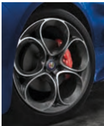
Roues sport de 19 po en aluminium à cinq trous Livrables en option sur la Ti Sport