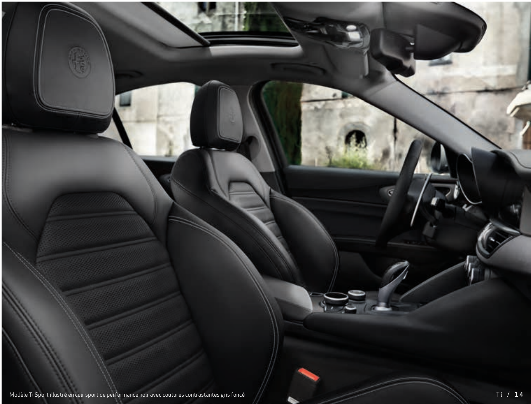
Modèle Ti Sport illustré en cuir sport de performance noir avec coutures contrastantes gris foncé