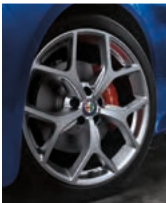
Roues de 19 po en aluminium poli et à rayons en Y Livrables en option sur la Giulia, Giulia Sport et Ti