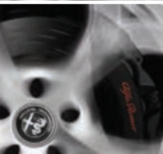
Étriers de frein anodisés De série sur la Quadrifoglio