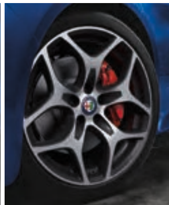
Roues de 18 po en aluminium poli et à deux rayons en Y De série sur le Ti