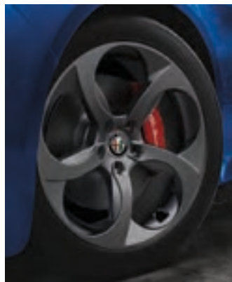
Roues sport de 18 po en aluminium De série sur la Giulia Sport