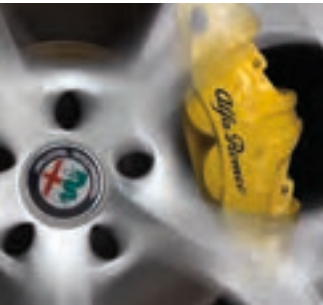
Étriers de frein jaunes Livrables en option