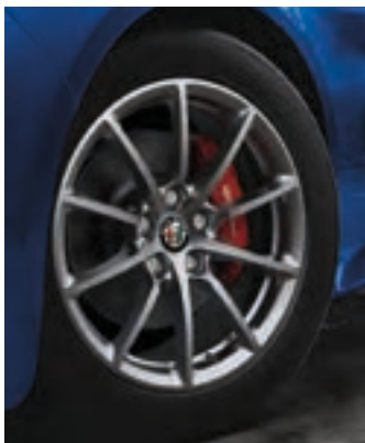
Roues de 17 po en aluminium brillant à 10 rayons De série sur la Giulia