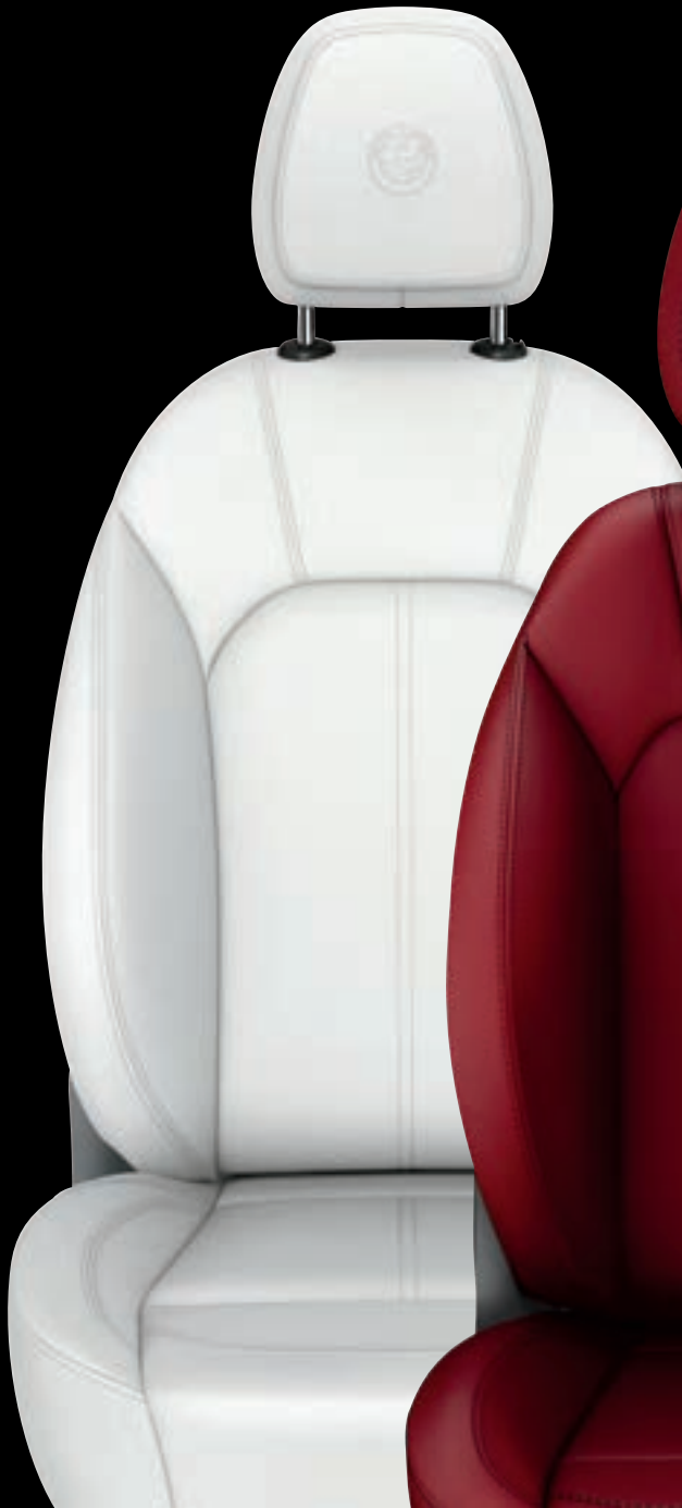
Garnissage de cuir couleur glace