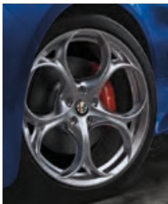
Roues de 19 po en aluminium brillant à cinq trous De série sur la Ti Sport