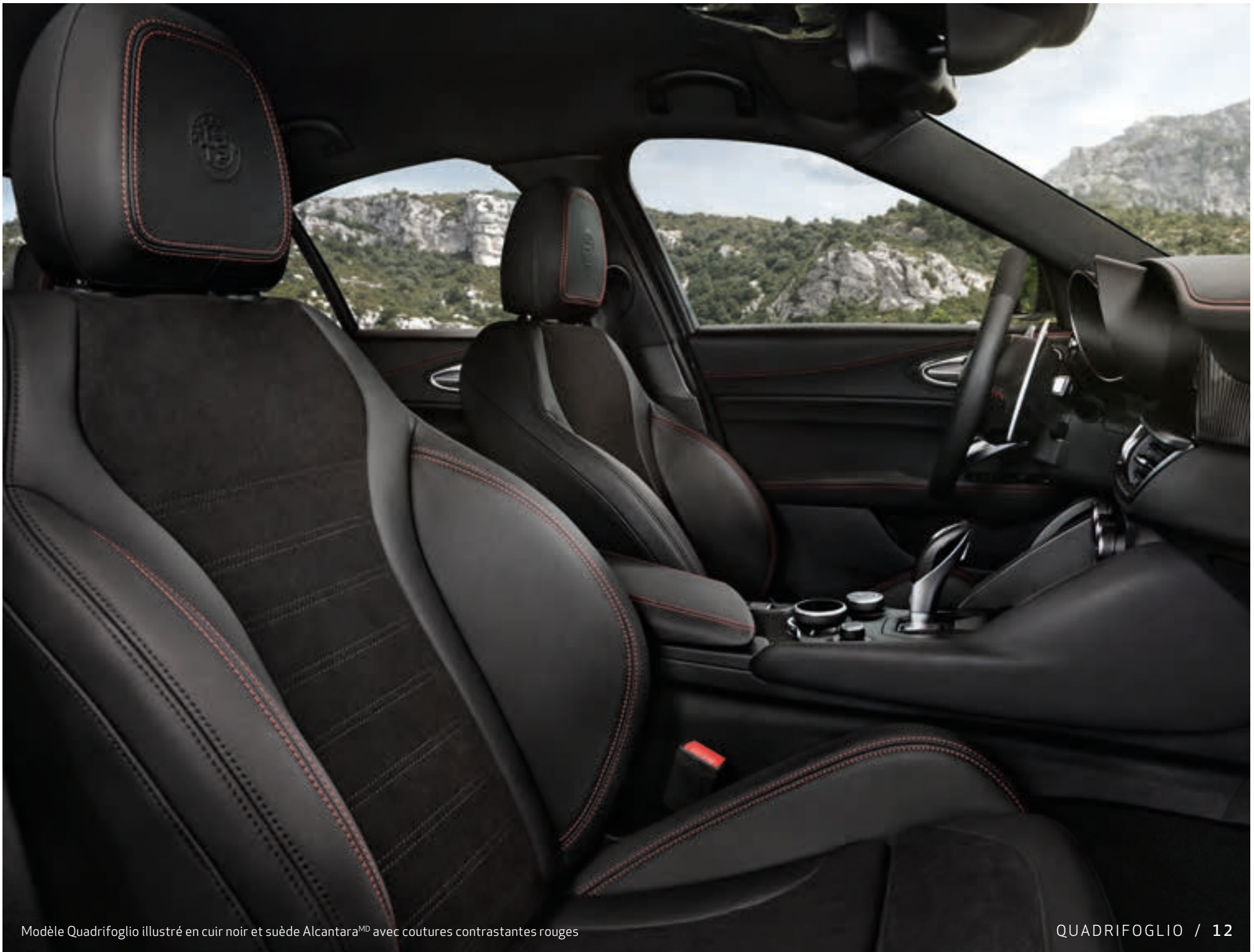
Modèle Quadrifoglio illustré en cuir noir et suède Alcantara MD avec coutures contrastantes rouges