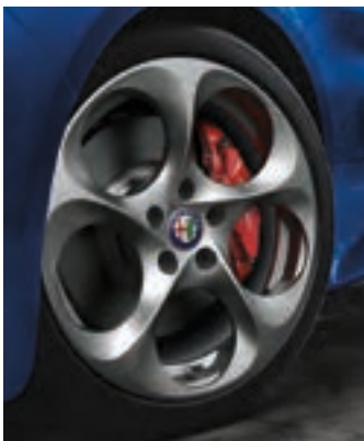
Roues de 17 po en aluminium Cerchio brillant Livrables en option sur la Giulia