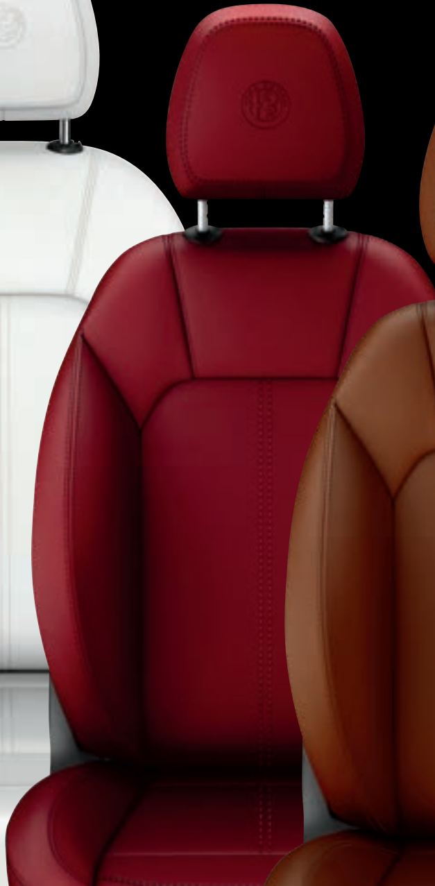
Garnissage de cuir rouge