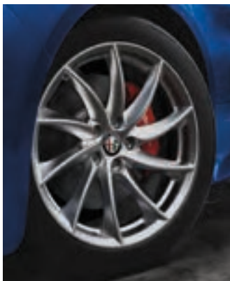
Roues Turbine de 18 po en aluminium brillant Livrables en option sur la Giulia