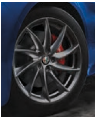
Roues Turbine de 18 po en aluminium foncé Livrables en option sur la Giulia