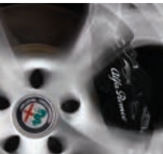
Étriers de frein noirs Livrables en option