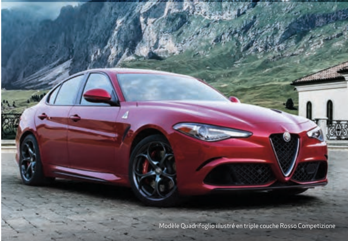
Modèle Quadrifoglio illustré en triple couche Rosso Competizione

Chaque jalon franchi tout au long de son histoire de plus d'un siècle a valu à Alfa Romeo un respect exponentiel. La Giulia a été lancée en 1962, marquant l'arrivée d'une version de route révolutionnaire du modèle d'Alfa Romeo qui connaissait un franc succès sur les pistes de course, alliant puissance extrême et technologies légères. La Giulia d'aujourd'hui rehausse cet héritage à tous les égards.