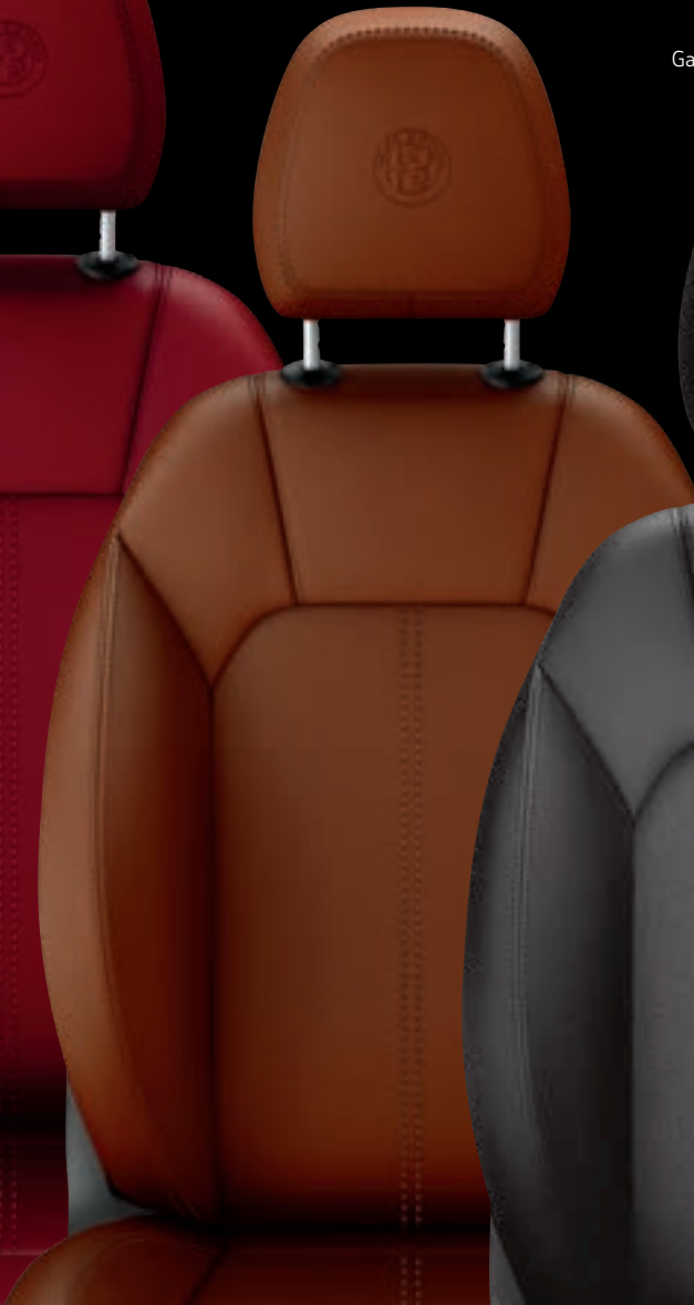
Garnissage de cuir havane