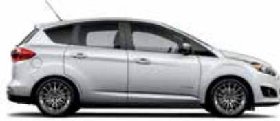
Argent lingot métallisé