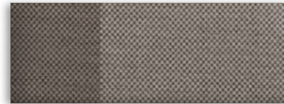
1 Tissu pierre moyen pâle avec éléments contrastants pierre moyen foncé