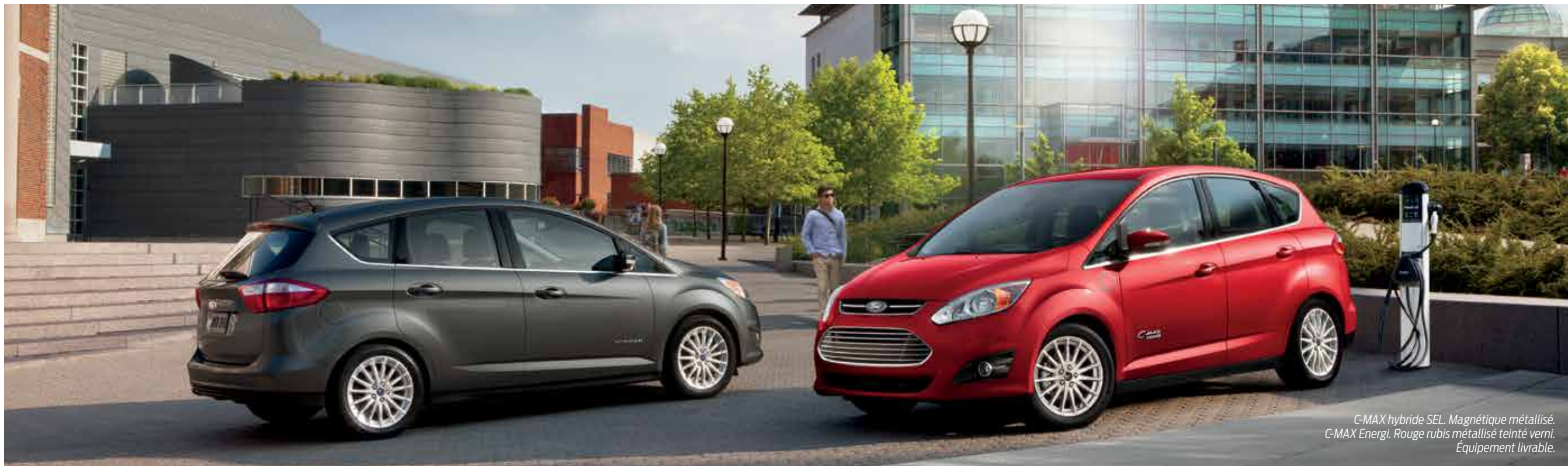
C-MAX hybride SEL. Magnétique métallisée. C-MAX Energi. Rouge rubis métallisé teinté verni. Équipement livrable.