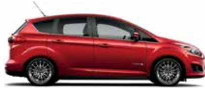
Rouge rubis métallisé teinté verni