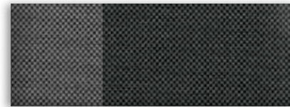
2 Tissu noir anthracite avec éléments contrastants pierre sterling