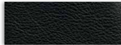
4 Cuir noir anthracite