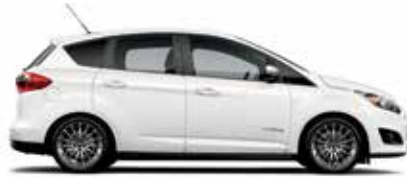
Blanc platine métallisé trois couches