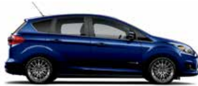
Bleu Kona métallisé