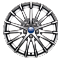
Jantes de 17 po en aluminium usiné De série