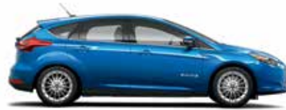
Bleu candi métallisé teinté verni