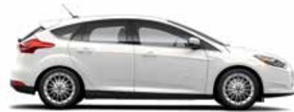
Blanc platine métallisé trois couches