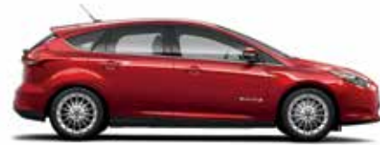
Rouge rubis métallisé teinté verni