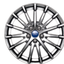
Jantes de 17 po à 15 rayons en aluminium De série