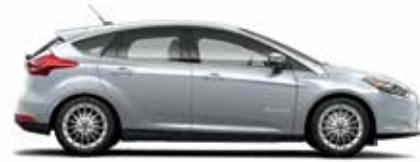
Argent lingot métallisé