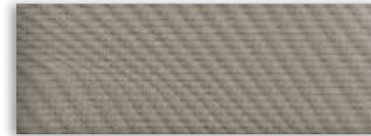
1 Tissu pierre moyen pâle – De série