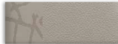
2 Cuir pierre pâle – Livrable