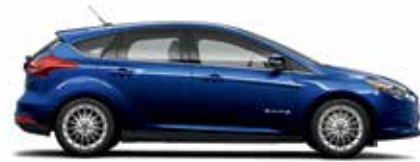
Bleu Kona métallisé