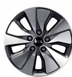
Jantes en alliage de 16 po