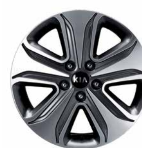
Jantes en alliage de 17 po