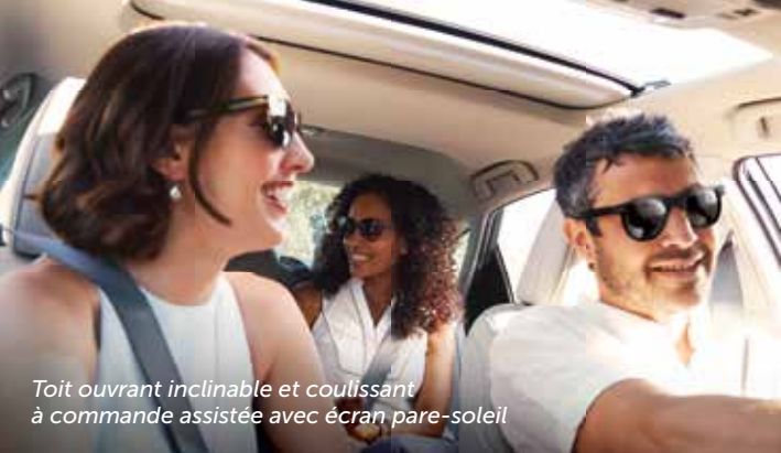
Toit ouvrant inclinable et coulissant à commande assistée avec écran pare-soleil