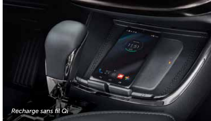
Recharge sans fil Qi