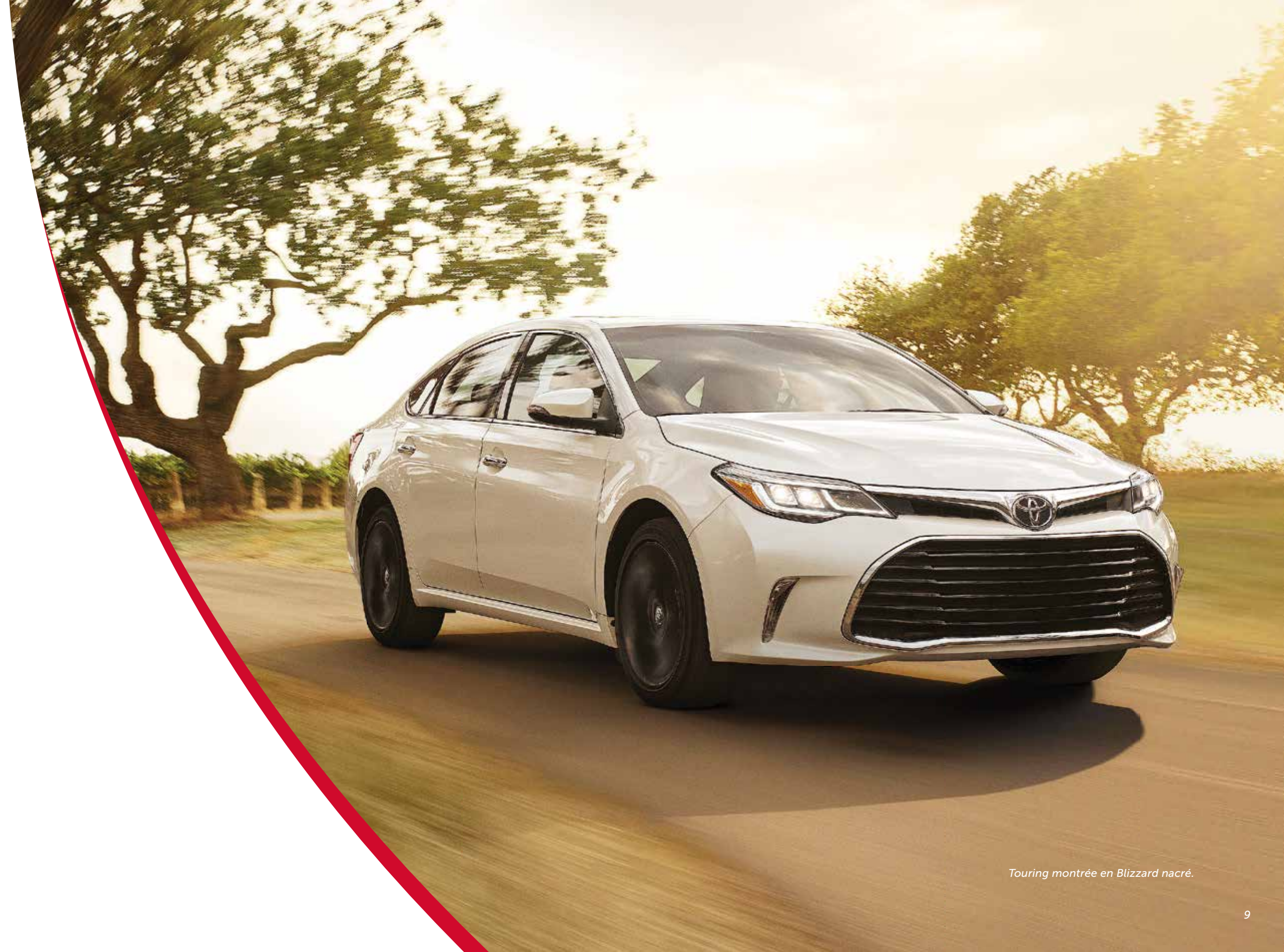
Touring montrée en Blizzard nacré.

10 COUSSINS GONFLABLES 1 L'Avalon est équipée de série de 10 coussins gonflables 1 , dont des coussins gonflables à deux phases pour le conducteur et le passager avant, des coussins gonflables de protection des genoux du conducteur et du passager avant, des coussins gonflables latéraux montés dans les sièges avant, des coussins gonflables latéraux montés dans les sièges arrière et des coussins gonflables latéraux en rideau à l'avant et à l'arrière.