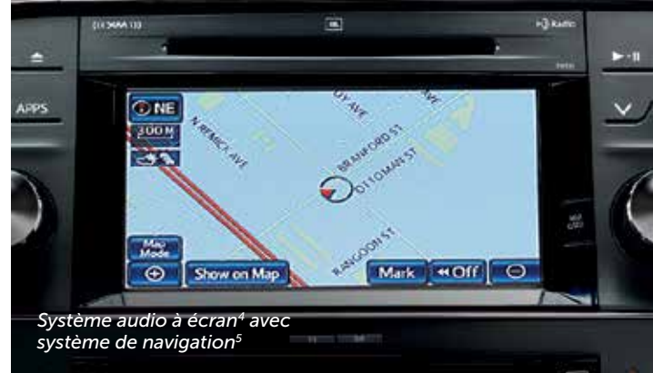
Système audio à écran* avec système de navigation 5