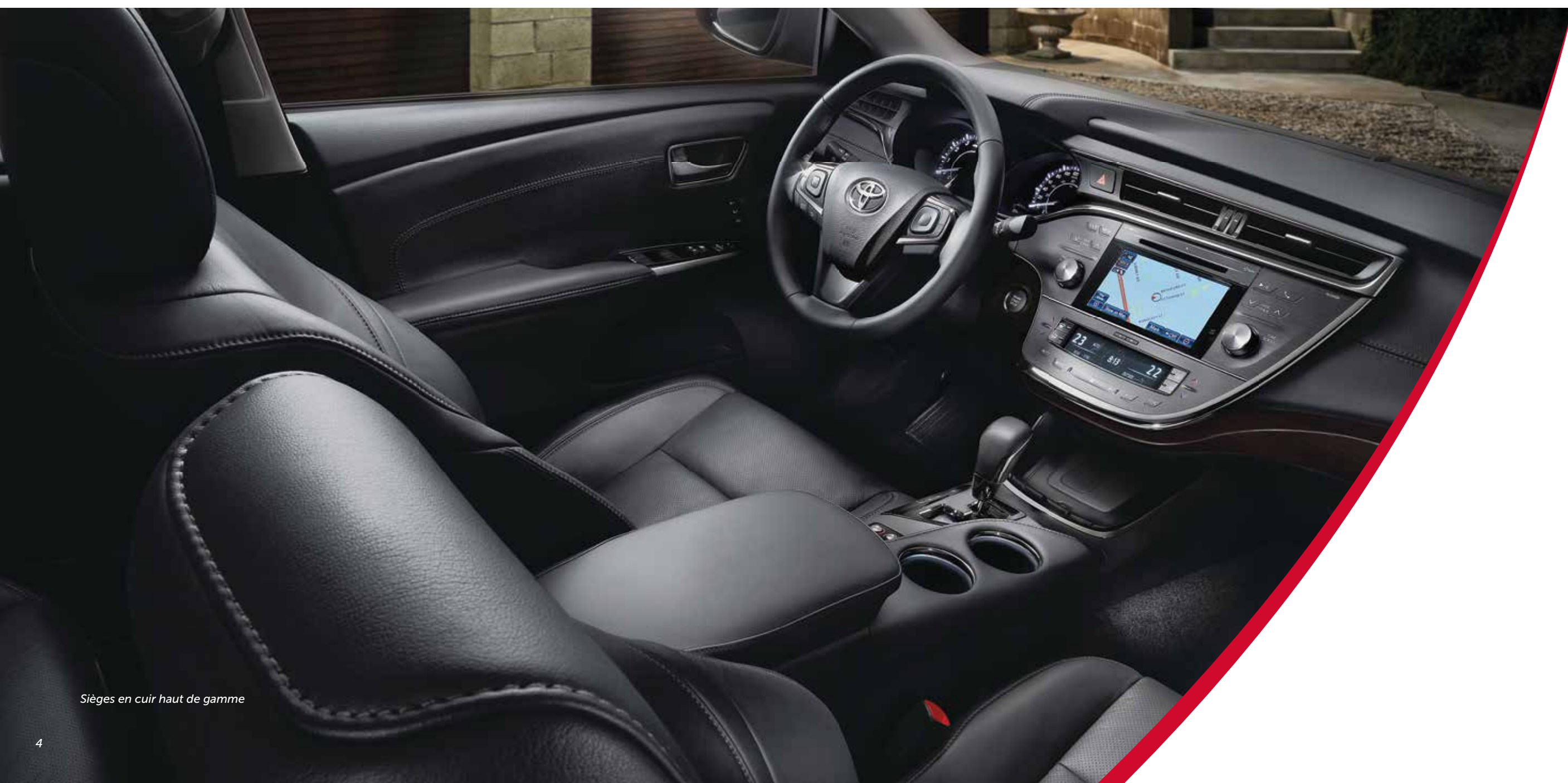
Sièges en cuir haut de gamme