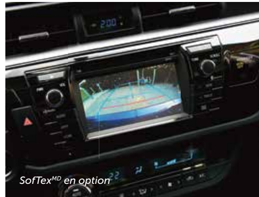
SofTex MD en option