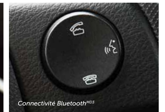
Connectivité Bluetooth MD3