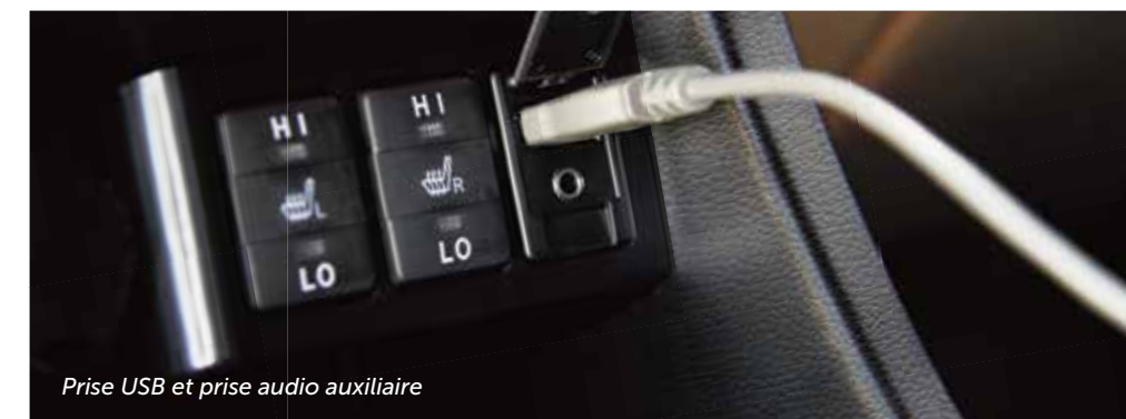
Prise USB et prise audio auxiliaire