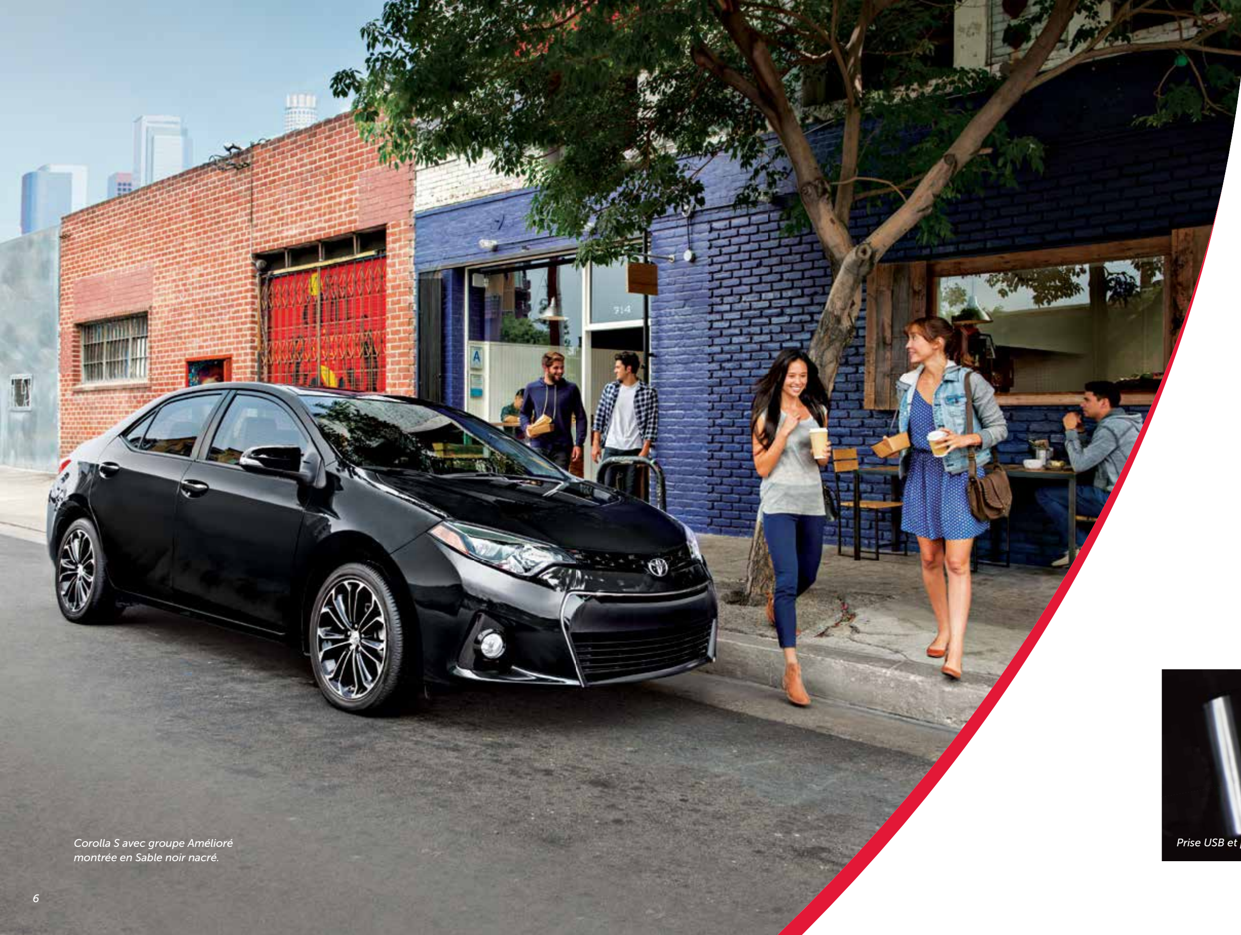
Corolla S avec groupe Amélioré montrée en Sable noir nacré.