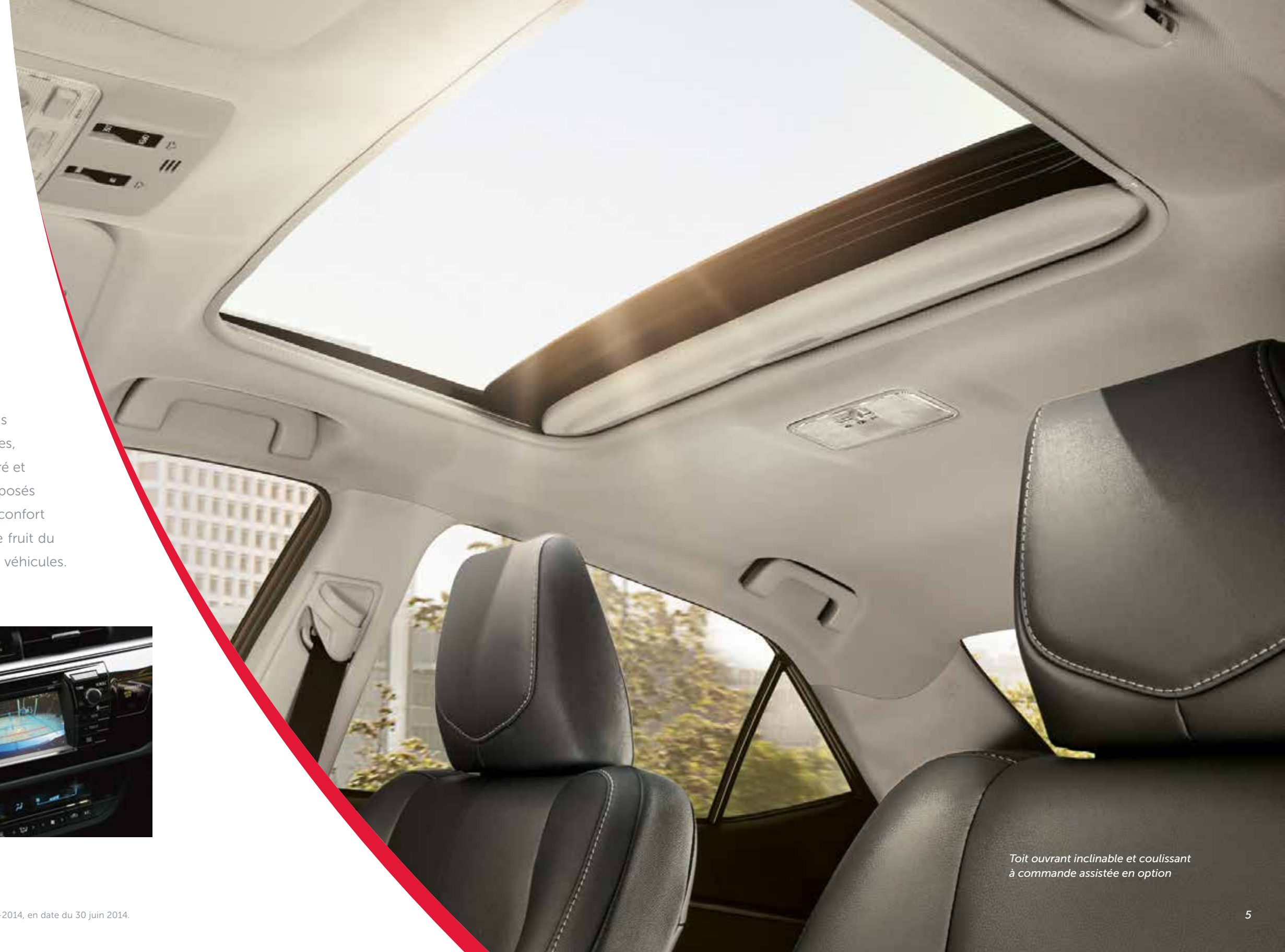
Toit ouvrant inclinable et coulissant à commande assistée en option