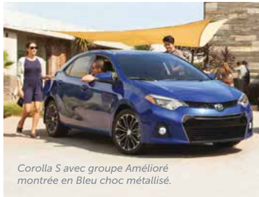
Corolla S avec groupe Amélioré montrée en Bleu choc métallisé.

La Corolla 2016 ne se résume pas à son superbe design extérieur, aussi époustouflant soit-il. Ses lignes aérodynamiques n'ont pas seulement pour but d'épater la galerie : elles améliorent la maniabilité, la stabilité et le rendement énergétique. Quant à l'intérieur, il se distingue par un éventail impressionnant de caractéristiques et de matériaux d'excellente facture. Ce qui n'a pas changé, ce sont les attributs qui ont contribué à la popularité de la Corolla, comme sa fiabilité et sa durabilité légendaires. La preuve? Plus de 80 % des Corolla vendues au Canada au cours des 20 dernières années sont encore en circulation aujourd'hui*. À bord de la nouvelle Corolla, vous éprouverez d'emblée un sentiment d'émerveillement. La qualité y est omniprésente avec, entre autres, des sièges accueillants, des matériaux doux au toucher et des garnitures distinctes au fini noir lustré et métallisé sur le tableau de bord. Les matériaux d'insonorisation et d'isolation, soigneusement disposés dans tout l'habitacle, aident à réduire les bruits et les vibrations pour améliorer un niveau de confort déjà impressionnant. Ce confort et cette qualité peuvent sembler naturels, mais ils ne sont pas le fruit du hasard – nous travaillons sans relâche à améliorer la conception esthétique et technique de nos véhicules. Ainsi, chaque trajet sera la promesse d'une expérience agréable.