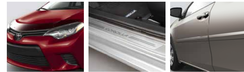
Déflecteur de capot

Système d'échappement TRD Barre stabilisatrice arrière TRD