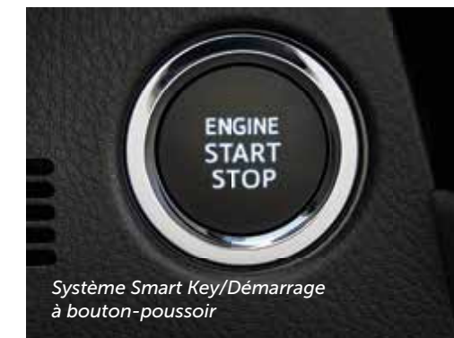
Système Smart Key/Démarrage à bouton-poussoir

Forte de sa tradition d'innovation, Toyota a produit sa Corolla la plus technologiquement évoluée à ce jour. Les commandes de série sur le volant sont disposées intelligemment pour vous donner accès au système audio et à la technologie sans fil Bluetooth MD3 mains libres. Le système audio à écran tactile de 6,1 po 4 en option permet la lecture musicale sans fil en continu, tandis que le système de navigation 5 livrable comprend une fonction unique « texte à voix » qui convertit les textos en messages vocaux retransmis par les haut-parleurs du véhicule. Résultat? Une voiture qui vous propulse vers l'avant à plus d'un titre.