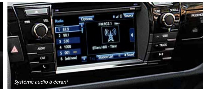
Système audio à écran 4