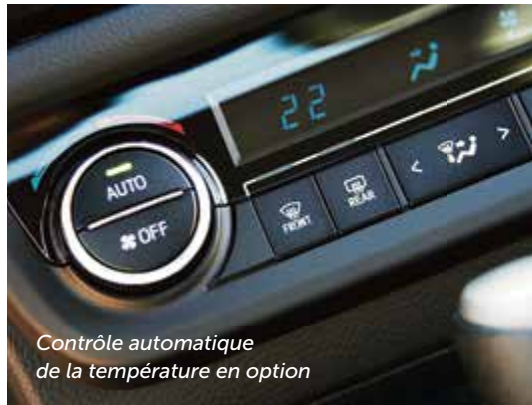
Contrôle automatique de la température en option