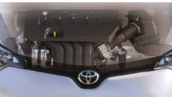
Corolla LE ECO montrée en Blanc alpin.

7,7 L/100 KM EN VILLE / 5,6 L/100 KM SUR ROUTE Le modèle LE ECO est équipé d'un moteur de 1,8 L développant 140 ch et utilisant la technologie Valvematic. Celle-ci optimise la levée des soupapes d'admission pour améliorer le rendement énergétique et procurer une cote de consommation combinée de 6,8 L/100 km.