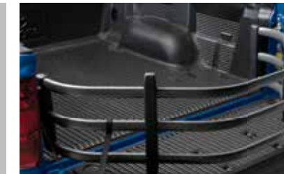
Rallonge de caisse