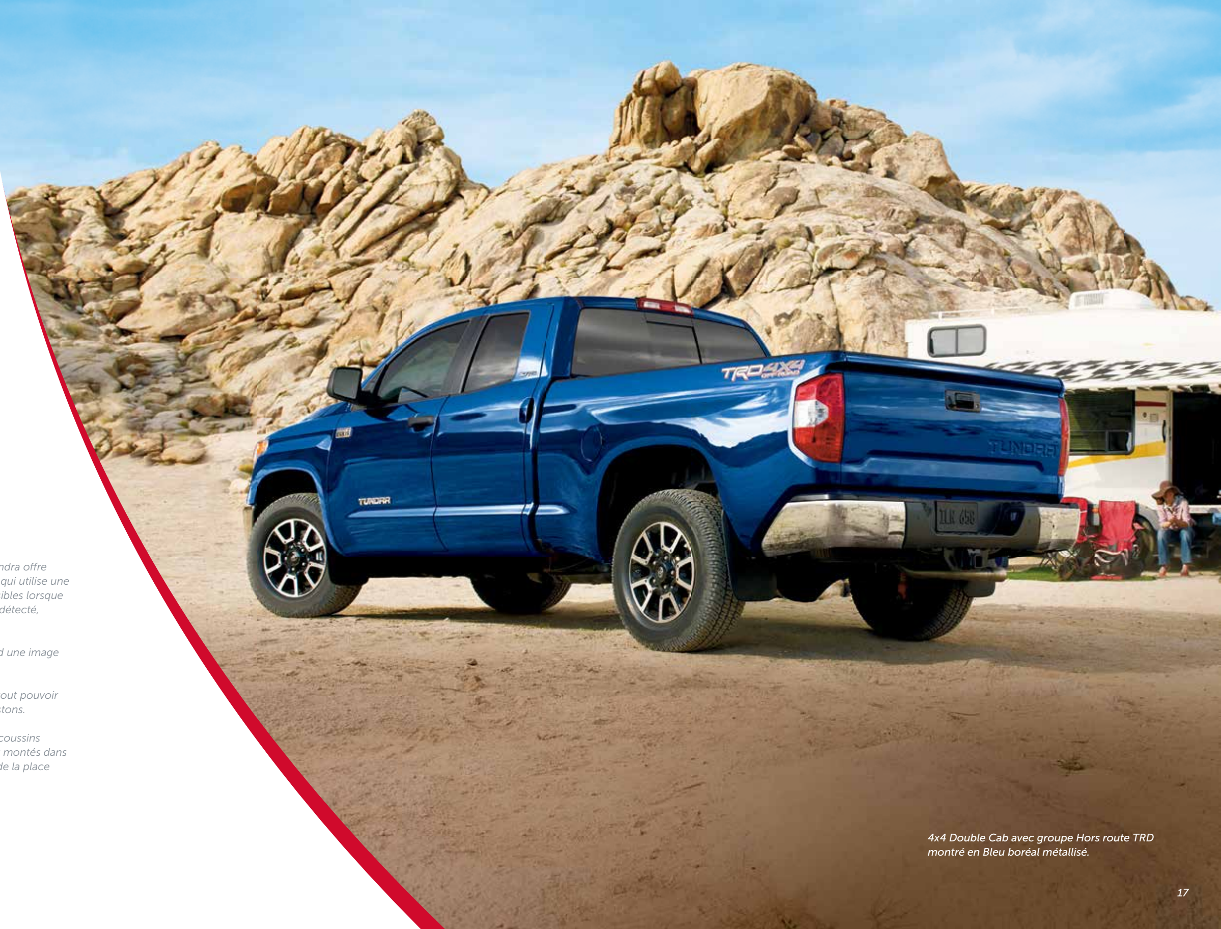
4x4 Double Cab avec groupe Hors route TRD montré en Bleu boréal métallisé.

8 COUSSINS GONFLABLES 1 Le Tundra est livré de série avec 8 coussins gonflables 1 , comprenant : coussins gonflables pour le conducteur et le passager de la place latérale avant, coussins gonflables latéraux montés dans les sièges avant, coussins gonflables de protection pour les genoux du conducteur et du passager de la place latérale avant et coussins gonflables latéraux en rideau à détecteur de roulis.