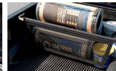
Séparateur de caisse