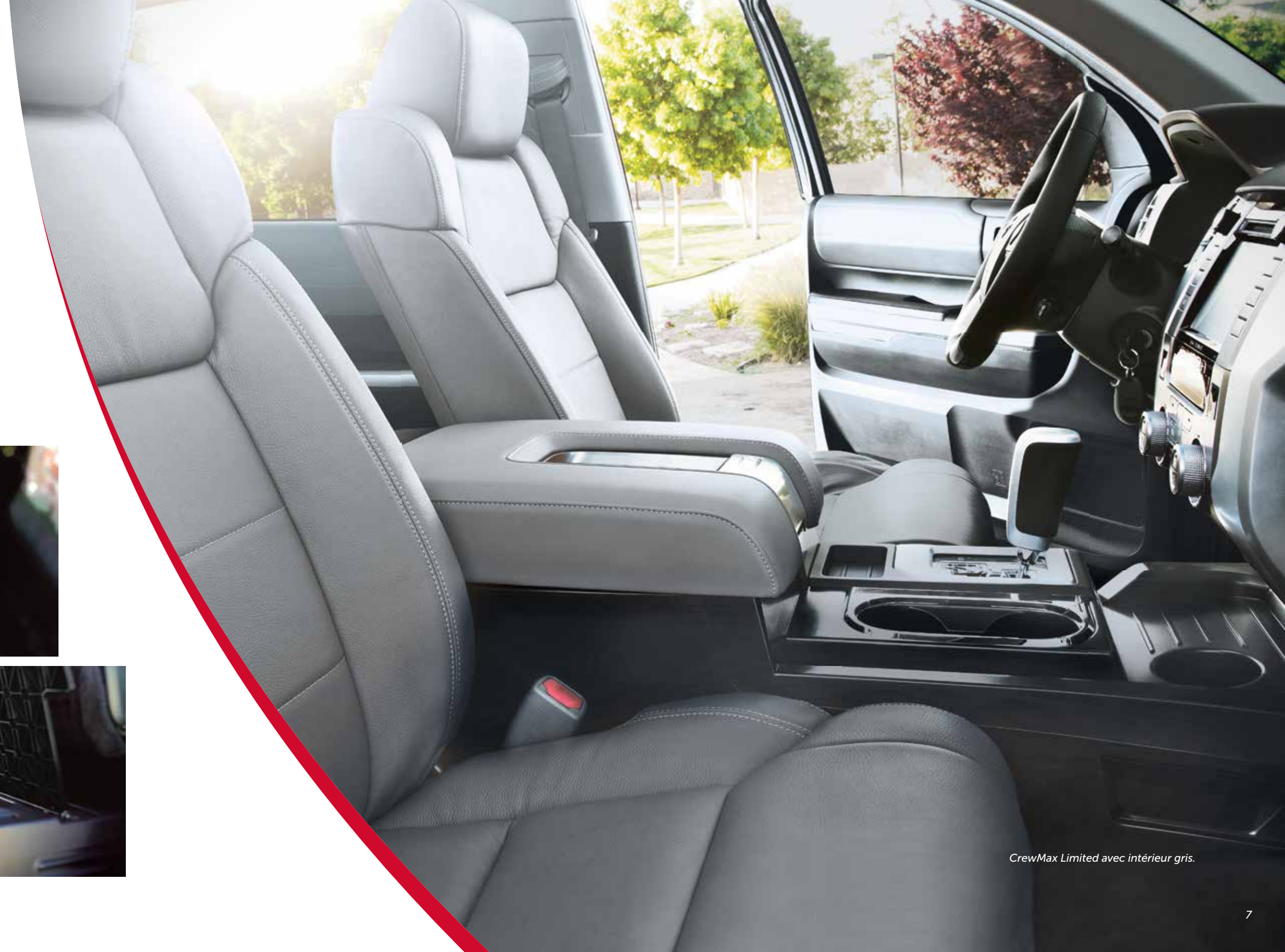
CrewMax Limited avec intérieur gris.