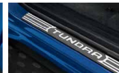
Protecteurs de seuil de portières