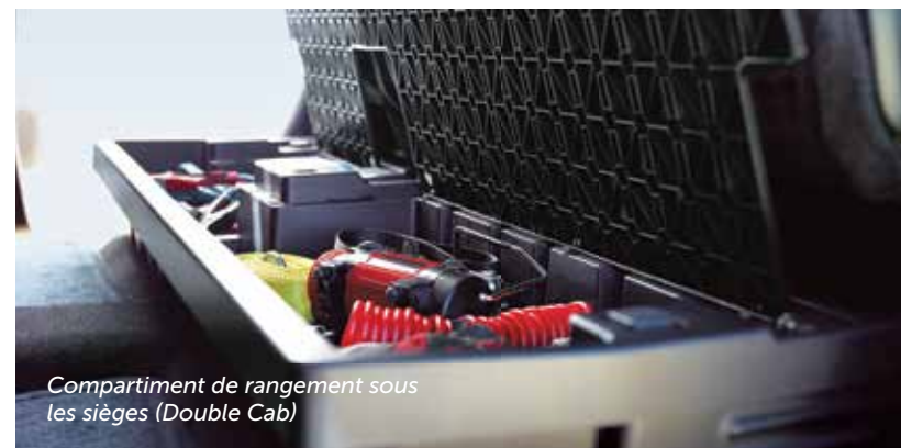
Compartiment de rangement sous les sièges (Double Cab)