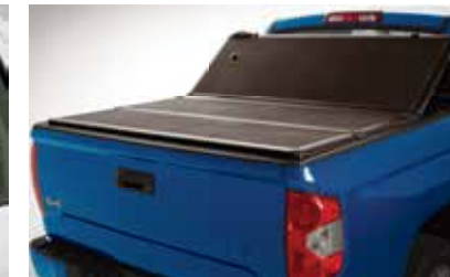
Couvre-caisse rigide à trois panneaux repliables