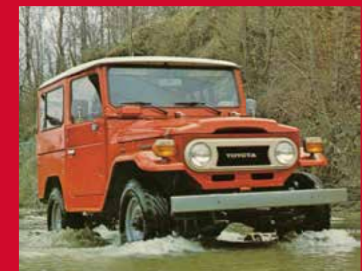
Toyota Land Cruiser

Avec 80 ans d'histoire derrière eux, il n'est pas étonnant que les camions Toyota soient le premier choix dans le monde entier 11 . Leur histoire est jalonnée d'événements marquants. Ils ont participé à plus d'éditions du rallye Dakar que n'importe quelle autre marque. Ils ont été les premiers à rouler au pôle Nord magnétique... et au pôle Sud. Avec un palmarès en compétition qui comprend 304 victoires hors route, 27 championnats des constructeurs et 28 championnats des pilotes hors route, ils se sont forgé une réputation de gagnants sur tous les continents. Les camions Toyota sillonnent les routes du monde entier depuis des décennies. Voilà pourquoi ils sont parfaits pour le Canada, d'un océan à l'autre, aujourd'hui et pendant encore de nombreuses années.