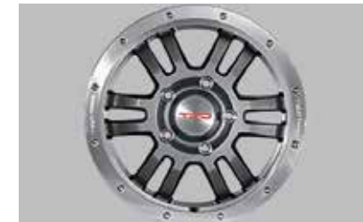
Roues de 17 po hors route forgées TRD