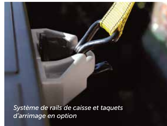
Système de rails de caisse et taquets d'arrimage en option