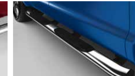
Barres-marchepieds latérales chromées de 5 po