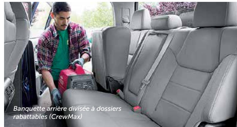
Banquette arrière divisée à dossiers rabattables (CrewMax)

La vraie beauté se niche dans les détails. Et c'est tant mieux, parce que nous avons pensé au moindre détail. Une boîte à gants dans laquelle vous pourrez ranger bien plus qu'une paire de gants de travail est une amélioration bienvenue, tout comme les porte-gobelets à l'arrière et une console au plafond facile d'accès, idéale pour ranger vos lunettes de soleil. Mais le souci du détail ne s'arrête pas là. Avec l'un des habitacles les plus spacieux du segment, chaque passager est assuré de voyager en tout confort, que ce soit pour se rendre sur le lieu de travail en semaine ou partir se détendre en fin de semaine.