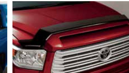
Déflecteur de capot