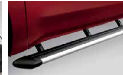
Barres-marchepieds latérales ovales de 4 po