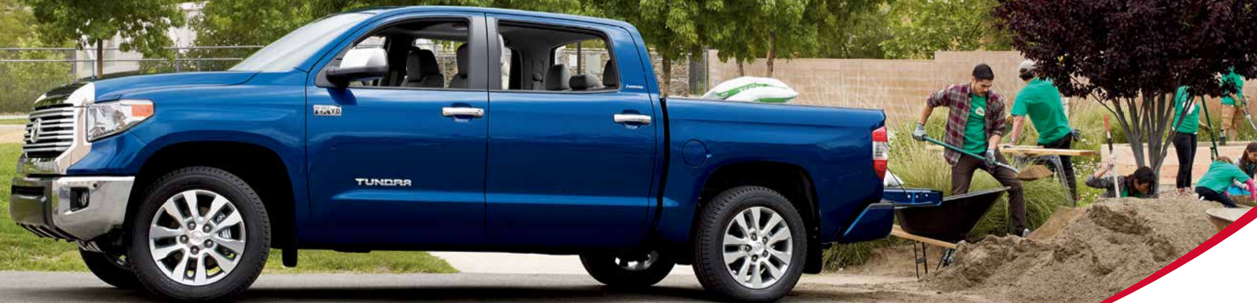
4x4 CrewMax Limited montré en Bleu boréal métallisé.

Que ce soit pour les travaux quotidiens, un projet en fin de semaine ou une aventure en famille, le Tundra s'acquitte de toutes ses missions avec facilité. Et avec un choix de deux moteurs à couple élevé et économes en carburant, vous ne risquez pas de manquer de puissance, quel que soit le travail à accomplir. Avec ses 381 ch et son couple de 401 lb-pi, le costaud V8 i-FORCE de 5,7 L ne recule devant aucune tâche, même les plus exigeantes. Quant au V8 i-FORCE V8 de 4,6 L, il est peut-être compact, mais avec son double système de distribution à calage variable intelligent (double VVT-i) et la technologie ACIS, il produit une puissance impressionnante de 310 ch et un couple de 327 lb-pi. Il a également fallu prévoir de dompter cette formidable puissance. C'est pourquoi Toyota a équipé le Tundra d'une boîte automatique à 6 rapports et d'un arbre d'entraînement à deux pièces en option. Que ce soit pour un projet qui vous tient à cœur ou pour un week-end en famille, vous pouvez toujours compter sur le Tundra.