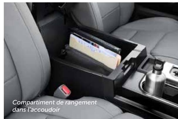
Compartiment de rangement dans l'accoudoir