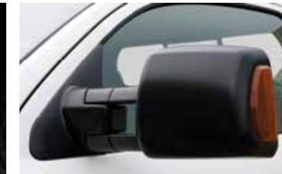
Rétroviseurs de remorquage